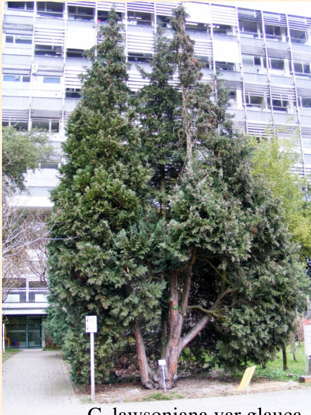
C. lawsoniana var glauca

Introduit en Europe en 1854, le cyprès de Lawson est depuis largement cultivé comme arbre ou arbuste d'ornement.